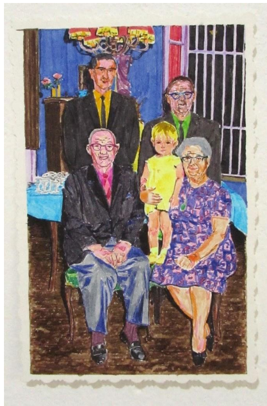
Mi familia - 18 cm x 12 cm - 2021